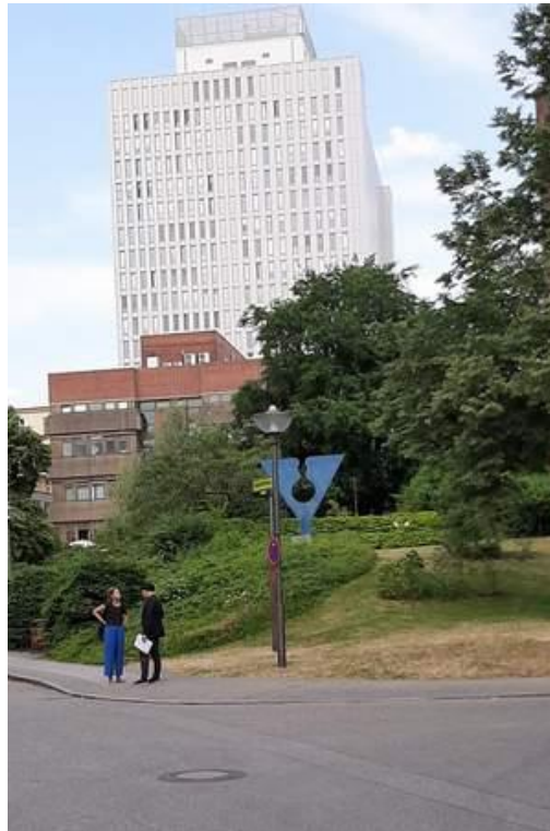
Das Hochhaus der Charité – im Vordergrund der Sauerbruch-Bunker unter dem grünen Hügel