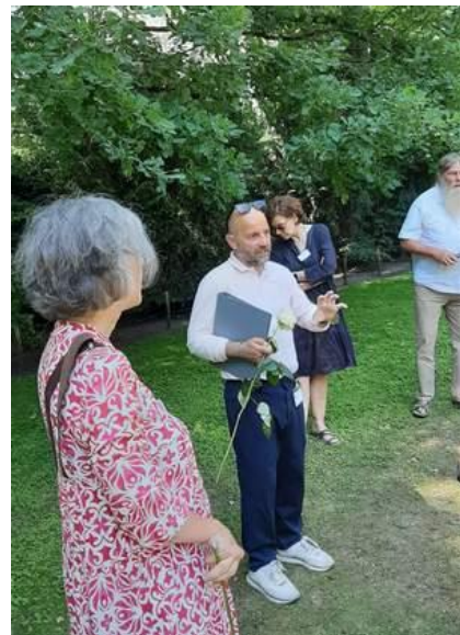
Am Denkmal zur Erinnerung der ermordeten Sinti und Roma