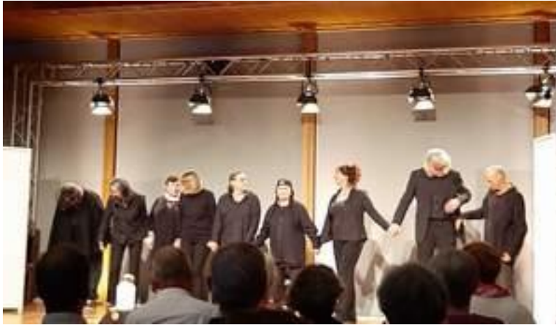
Theatergruppe „Die Oppelner“

Die Theatergruppe „Die Oppelner“ existiert seit zehn Jahren. Sie leben zusammen in einer Hausgemeinschaft in Kreuzberg. Viele der Biographien in dem Stück sind von den Spielern selbst geschrieben.