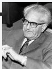
Fritz Bauer Freundeskreis